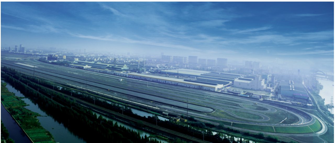
瑪吉斯輪胎測試場

正新最高治理機構為董事會，旨在監督公司在執行有關會計、稽核、財務報導流程及財務控制上的品質和誠信度。董事會下設有稽核室、審計委員會及薪酬委員會，協助董事會履行監督之責。